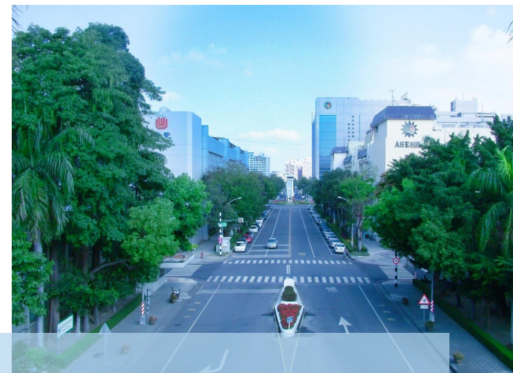
共築廉潔未來：企業服務廉政平臺